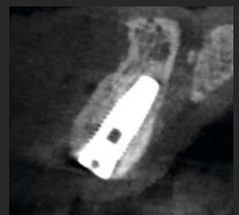
Abbildung 4. Ergebnis nach fünfmonatiger Heilung. Beachten Sie den nachgewachsenen bukkalen Knochen.