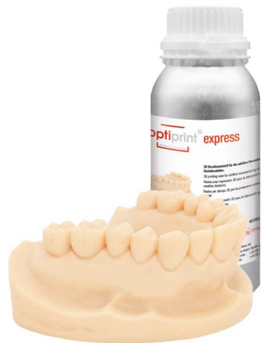
optiprint ® express Germany's favorite 3D Resin

Das erste schnelle Modellharz mit Gipsoptik.