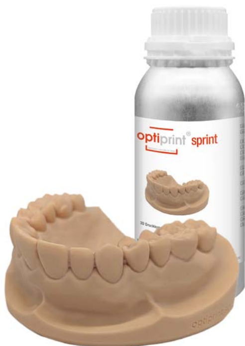
optiprint ® sprint Germany's favorite 3D Resin

Das erste schnelle Modellharz mit Gipsoptik.