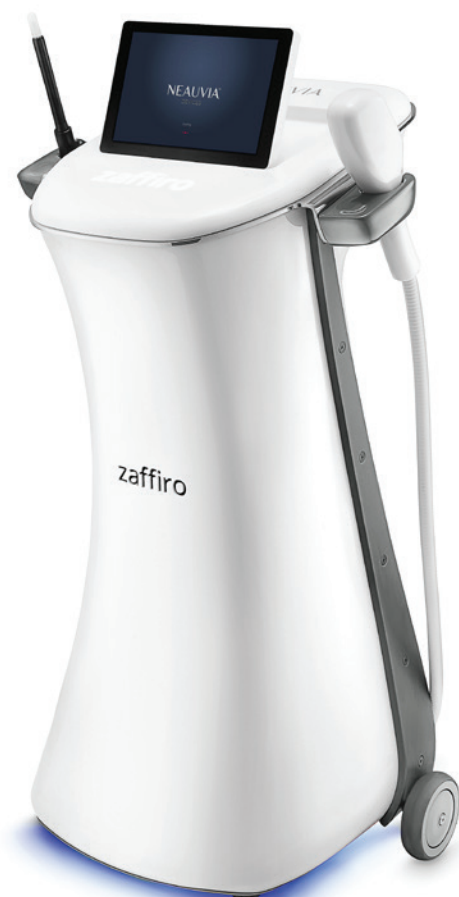
02 Zaffiro (© NEAUVIA®)

Mit dem Zaffiro ist ebenfalls ein zukunftsweisendes medizinisches Gerät auf dem Markt, das mehr als nur eine Behandlungsmöglichkeit bietet. Kombiniert werden zwei fortschrittliche, synergetische Technologien miteinander, die sich gegenseitig ergänzen und verstärken. Neben der Funktion zur gezielten Hydroexfoliation ist Zaffiro auch mit einem Thermo-Lift-Handstück ausgestattet, das mittels Nahinfrarotenergie eine Vielzahl von Indikationen (angefangen von Alterungserscheinungen bis hin zu dehydrierter und zu Akne neigender Haut) behandeln kann. Auf diese Weise ist in kürzester Zeit ein zweistufiger Behandlungsablauf möglich, der zu einer sofortigen Straffung und einer deutlichen Verbesserung von Widerstandsfähigkeit und Textur der Haut führt.