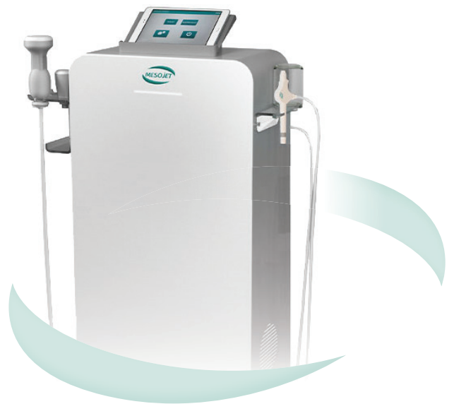
01 MesoJet HY-PO RF

Für die Hydroporation wird das Handstück des MesoJet HY-PO RF im Abstand von etwa fünf Millimetern über die Hautoberfläche geführt, um diese sanft zu peelen. Rötungen entstehen dabei keine. Während der Anwendung können gleichzeitig spezielle Wirkstofflösungen, sogenannte Jet Solutions™, in tiefe Hautschichten eingeschleust werden. Gewährleistet wird dies aufgrund der Barophorese, erzeugt durch die behandlungsbedingte sanfte Dehnung der Haut und das Öffnen der Mikrokanäle. Im Gegensatz zur topischen Anwendung der gleichen Produktmenge dringen die verwendeten Wirkstofflösungen schon nach 30 Sekunden in die Haut ein und wirken somit bis zu zwölfmal effektiver. Durch das gründliche Peeling und die Infusion von Wirkstoffen erhält die Haut nach einer Sitzung tiefgehende Feuchtigkeit und einen außergewöhnlichen Glow.