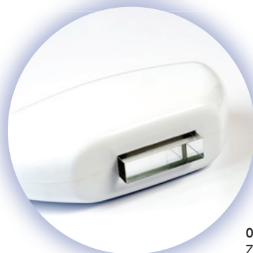
03a-03c Zaffiro