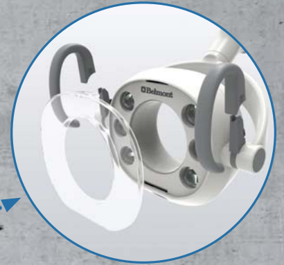
Abnehmbare Griffe und Abdeckung