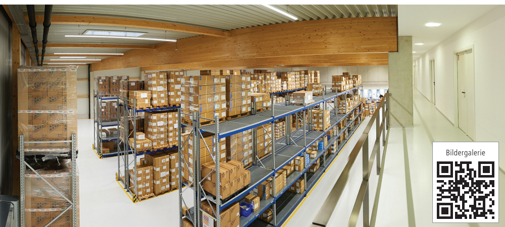
Abb. 5: Das europäische Zentrallager garantiert durch seinen umfassenden Bestand eine schnelle Lieferfähigkeit sämtlicher in Europa verkaufter NSK-Produkte.