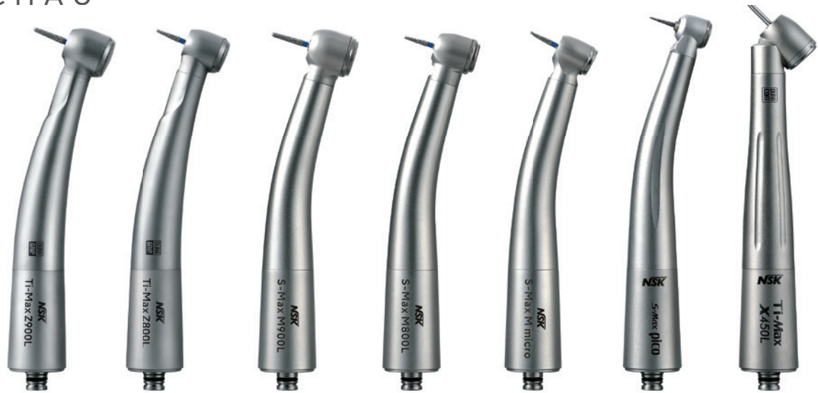
Abb. 4: Handstücke, Winkelstücke und Turbinen – damals wie heute die wichtigste Produktgruppe bei NSK und verantwortlich für die Markenbekanntheit.