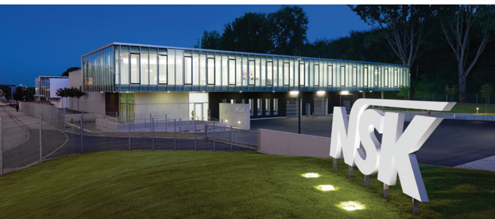
Abb. 1: Die europäische Zentrale von NSK Europe in Eschborn zollt der dynamischen Entwicklung des Unternehmens Rechnung und bietet ausreichend Platz für die kontinuierlich gestiegene Anzahl an Mitarbeitern.