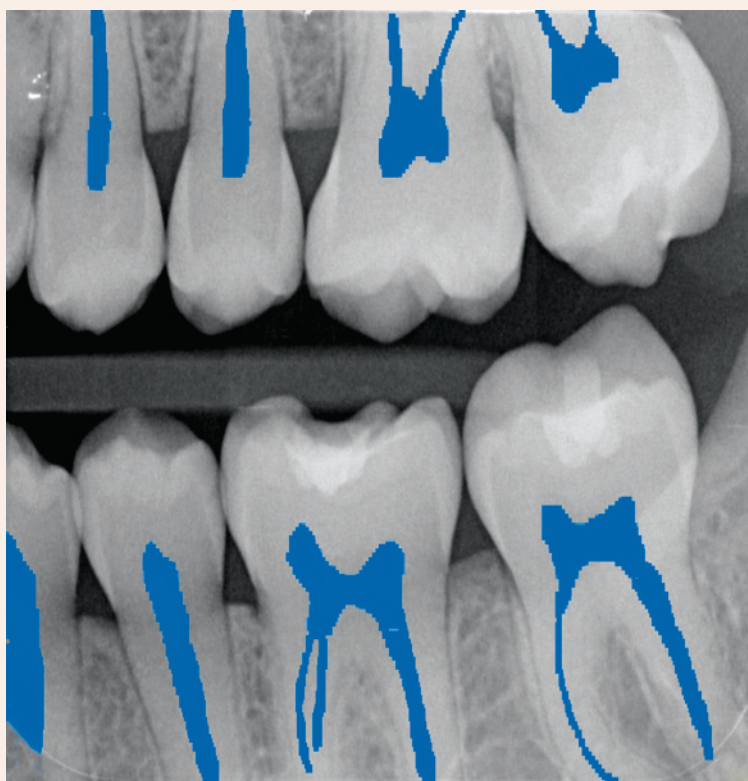
Abb. 2: Segmentierung der Wurzelkanäle auf einer Bissflügelaufnahme.