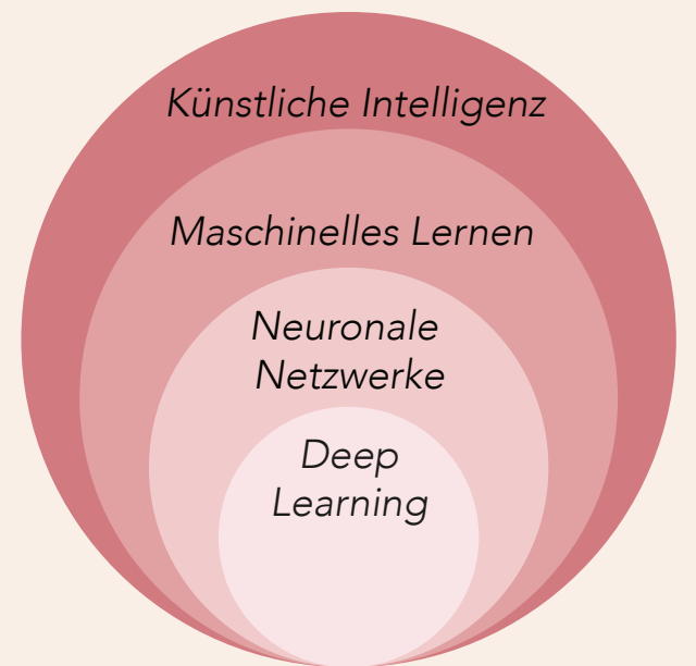
Abb. 1: Dargestellt sind die häufigsten Termini, die unter dem Sammelbegriff „künstliche Intelligenz“ zusammengefasst werden.

„Während des Analyseprozesses lernt man auch, welche Fragestellungen ggf. neu formuliert werden müssen.“