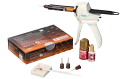
GRADIA® CORE Dualhärtendes Composite für Stumpfaufbauten und Stiftbefestigungen