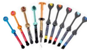
GC Composite Lichthärtendes Composites