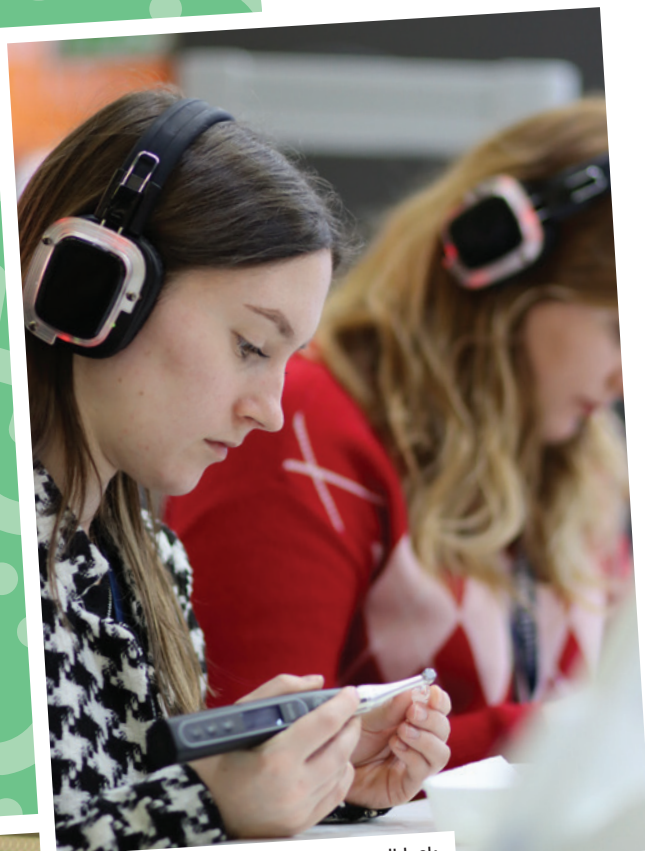
Testen von FQ und Procodile Q am Acrylblock

Komet Dental Gebr. Brasseler GmbH & Co. KG www.kometdental.de