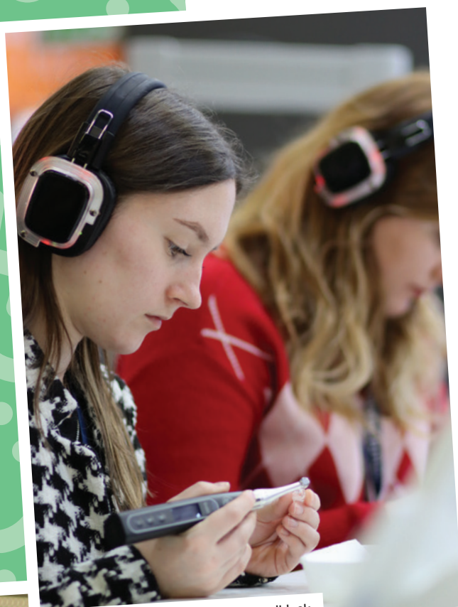
Testen von FQ und Procodile Q am Acrylblock

Komet Dental Gebr. Brasseler GmbH & Co. KG www.kometdental.de