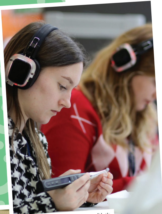
Testen von FQ und Procodile Q am Acrylblock

Komet Dental Gebr. Brasseler GmbH & Co. KG www.kometdental.de