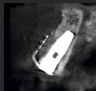
Abbildung 3. Postoperative Situation mit eingesetztem Implantat und eingesetzter NeoGen Cape PTFE-Membran.