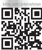
Infos zum Unternehmen

Welche Praxisverwaltungssoftware passt zu dir? Jetzt scannen und testen! Mehr erfahren: www.dampsoft.de/ds4