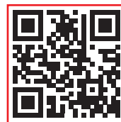
ISMI Infos zur Fachgesellschaft

ISMI – International Society of Metal Free Implantology office@ismi.me • www.ismi.me