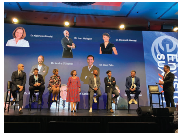
Abb. 2: Das Who is Who der KFO-Referenten – auf einer Bühne: Ormco konnte für den ORTHO-Track des Envista Summit hochkarätige internationale Referenten gewinnen.