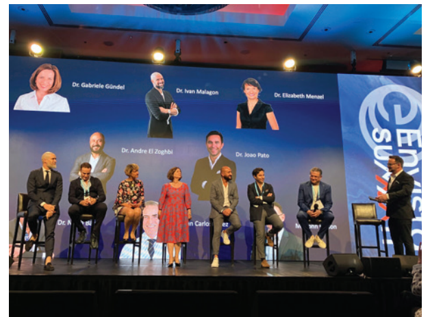
Abb. 2: Das Who is Who der KFO-Referenten – auf einer Bühne: Ormco konnte für den ORTHO-Track des Envista Summit hochkarätige internationale Referenten gewinnen.