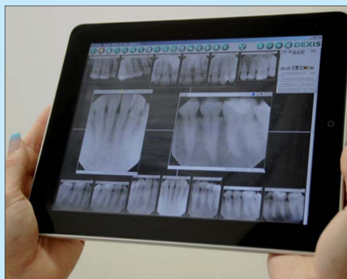
Das große Multitouch-Display kann gezielt im Patientengespräch eingesetzt werden.

Mit dem Apple iPad® werden digitale Röntgenbilder vom DEXIS® Platinum Sensor jetzt noch mobiler. Mit einer portablen Dual-Monitor-Lösung können DEXIS®-Röntgenbilder für das Patientengespräch auf den Touch-PC transferiert werden. Praxisinhaber haben die Möglichkeit, digitale Patientenaufnahmen aus der DEXIS®-Software drahtlos mit dem Apple iPad® zu verknüpfen und das iPad® als Zweitmonitor mit der vollen Funktionalität der DEXIS®-Software im Touchscreen-Modus zu verwenden. Die DEXIS®-Software kommuniziert mit der Applikation und erlaubt das drahtlose Betrachten der Röntgenbilder und den jeweiligen Befunden am iPad®. Die Datenübertragung erfolgt über eine WLAN-Verbindung. Die Navigation der DEXIS®-Software gestaltet sich intuitiv wie gewohnt und zudem bequem per Touchscreen. Das 9,7" Widescreen-Display mit LED-Hintergrundbeleuchtung und Hochglanzanzeige setzt dabei neue Maßstäbe in der Patientenkommunikation. KN