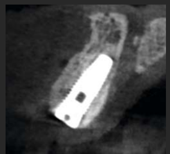
Abbildung 4. Ergebnis nach fünfmonatiger Heilung. Beachten Sie den nachgewachsenen bukkalen Knochen.