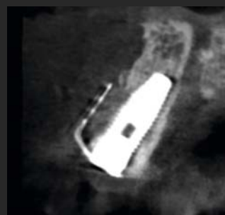
Abbildung 3. Postoperative Situation mit eingesetztem Implantat und eingesetzter NeoGen Cape PTFE-Membran.