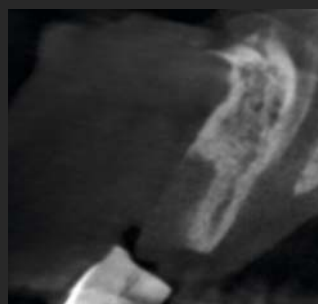
Abbildung 2. CBCT-Aufnahme der Ausgangssituation.