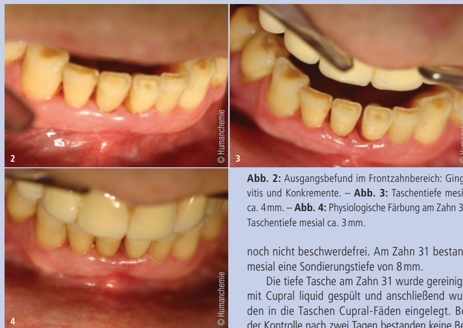
Abb. 2: Ausgangsbefund im Frontzahnbereich: Gingivitis und Konkremente. – Abb. 3: Taschentiefe mesial ca. 4 mm. – Abb. 4: Physiologische Färbung am Zahn 31, Taschentiefe mesial ca. 3 mm.

Eine spezielle Form ist das einfach anzuwendende Cupral liquid. Dabei handelt es sich um eine gebrauchsfertige Spüllösung für Wurzelkanäle und