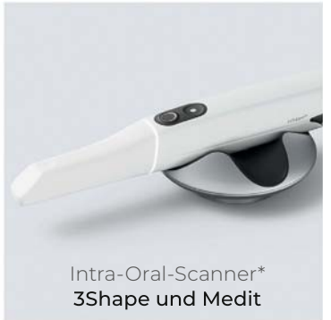
Intra-Oral-Scanner* 3Shape und Medit

*Permadental verarbeitet die Daten sämtlicher gängigen Scanner-Systeme.