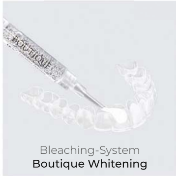
Bleaching-System Boutique Whitening