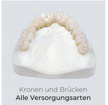
Kronen und Brücken Alle Versorgungsarten