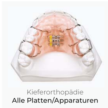
Kieferorthopädie Alle Platten/Apparaturen