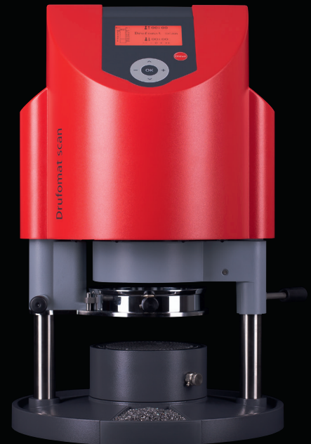
Der Druformat scan

Nach wie vor überzeugt von diesem Verfahren, arbeiten wir weiter daran, die Tiefziehtechnik stetig zu ver- bessern.