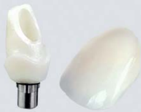
Implantologie Alle Systeme