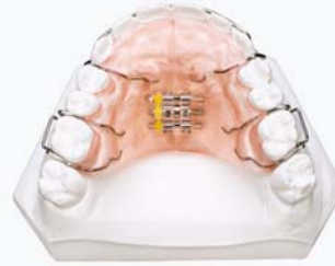
Kieferorthopädie Alle Platten/Apparaturen