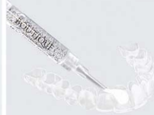
Bleaching-System Boutique Whitening