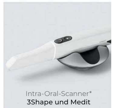
Intra-Oral-Scanner* 3Shape und Medit

*Permadental verarbeitet die Daten sämtlicher gängigen Scanner-Systeme.