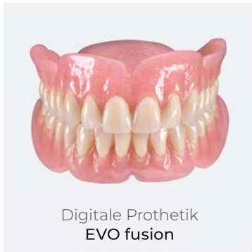
Digitale Prothetik EVO fusion