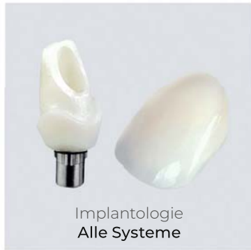
Implantologie Alle Systeme