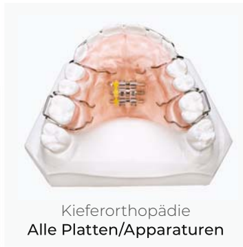
Kieferorthopädie Alle Platten/Apparaturen