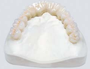
Kronen und Brücken Alle Versorgungsarten