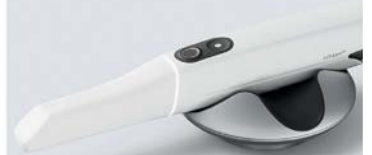
Intra-Oral-Scanner* 3Shape und Medit

*Permamental verarbeitet die Daten sämtlicher gängigen Scanner-Systeme.