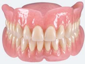
Digitale Prothetik EVO fusion