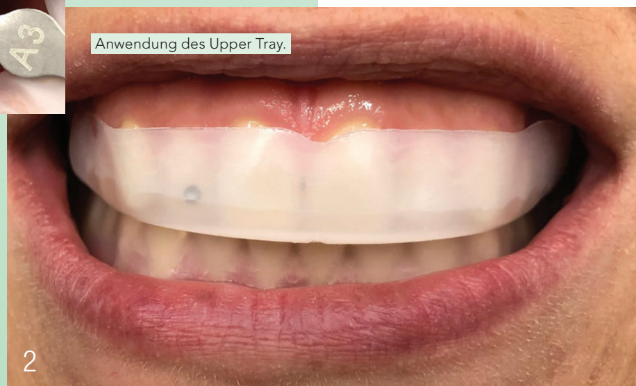
Anwendung des Upper Tray.

Im Vorfeld der Zahnaufhellung wies ich sie auf die Notwendigkeit einer professionellen Zahnreinigung hin, um Verfärbungen und Beläge zu entfernen. Darüber hinaus klärte ich sie über das eventuelle Risiko von auftretenden Sensibilitäten während einer Zahnaufhellung auf. Zahnaufhellungen sind häufig eine ideale Maßnahme für weißere Zähne. Vorhandene Füllungen oder Zahnersatz, wie beispielsweise Kronen und Brücken, werden allerdings nicht aufgehellt.