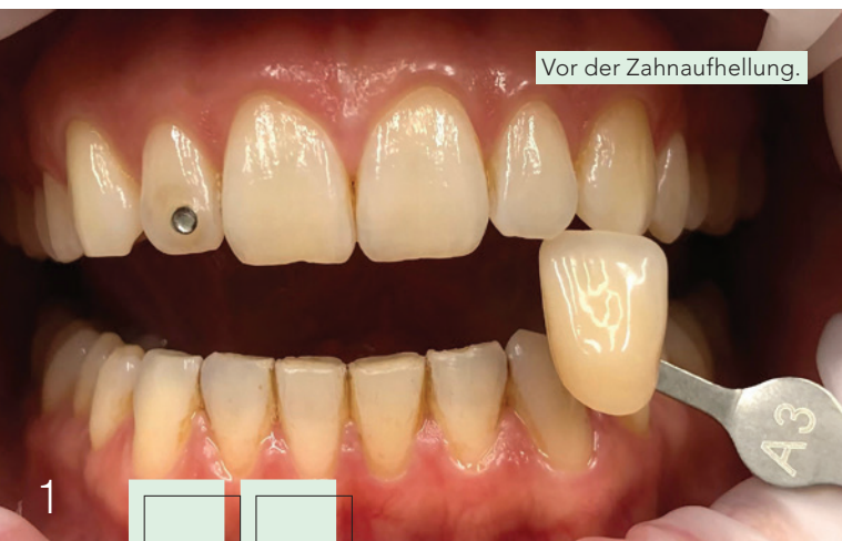
Vor der Zahnaufhellung.

Im Vorfeld der Zahnaufhellung wies ich sie auf die Notwendigkeit einer professionellen Zahnreinigung hin, um Verfärbungen und Beläge zu entfernen. Darüber hinaus klärte ich sie über das eventuelle Risiko von auftretenden Sensibilitäten während einer Zahnaufhellung auf. Zahnaufhellungen sind häufig eine ideale Maßnahme für weißere Zähne. Vorhandene Füllungen oder Zahnersatz, wie beispielsweise Kronen und Brücken, werden allerdings nicht aufgehellt.