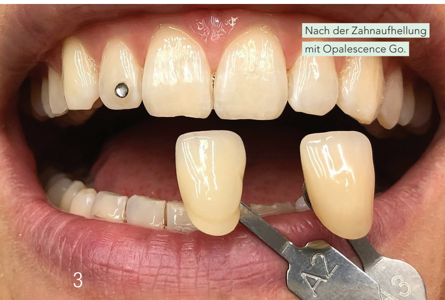
Nach der Zahnaufhellung mit Opalescence Go.