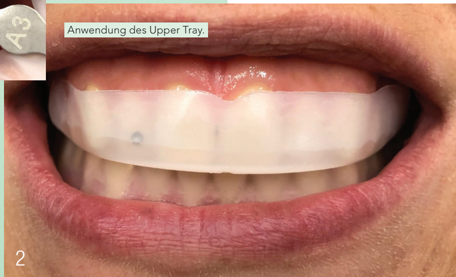
Anwendung des Upper Tray.

Im Vorfeld der Zahnaufhellung wies ich sie auf die Notwendigkeit einer professionellen Zahnreinigung hin, um Verfärbungen und Beläge zu entfernen. Darüber hinaus klärte ich sie über das eventuelle Risiko von auftretenden Sensibilitäten während einer Zahnaufhellung auf. Zahnaufhellungen sind häufig eine ideale Maßnahme für weißere Zähne. Vorhandene Füllungen oder Zahnersatz, wie beispielsweise Kronen und Brücken, werden allerdings nicht aufgehellt.