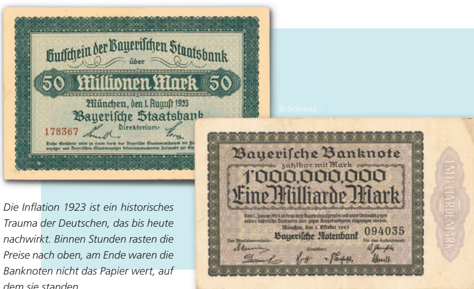
Die Inflation 1923 ist ein historisches Trauma der Deutschen, das bis heute nachwirkt. Binnen Stunden rasten die Preise nach oben, am Ende waren die Banknoten nicht das Papier wert, auf dem sie standen.

Förster: Der Verwaltungsbetrieb wurde auch nach Kriegsende ohne nennenswerte Unterbrechung fortgeführt. Im Zuge der Währungsreform 1948 konnte das Versorgungswerk zudem beweisen, dass es auch in Extremsituationen in der Lage ist, wirtschaftliche Sicherheit zu gewährleisten. Nach der Währungsgesetzgebung war die BÄV lediglich zur Auszahlung eines Zehntels der am Währungsstichtag