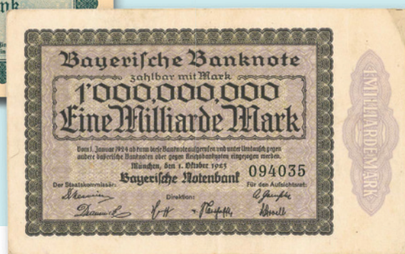
Die Inflation 1923 ist ein historisches Trauma der Deutschen, das bis heute nachwirkt. Binnen Stunden rasten die Preise nach oben, am Ende waren die Banknoten nicht das Papier wert, auf dem sie standen.

durchleuchtet und angepasst. Eine berufsständisch verfasste und demokratisch verwaltete Standeseinrichtung passte nicht in das politische Bild der Machthaber. Mehrfach wurden Versuche unternommen, nicht nur die Rechtsgrundlagen der BÄV, sondern auch deren gesamte Existenz infrage zu stellen. Da das Versorgungswerk nicht bei einer berufsständischen Kammer, sondern organisatorisch bei der Bayerischen Versicherungskammer als Behörde im Geschäftsbereich des Bayerischen Innenministeriums verankert war, konnte es allerdings nicht ohne Weiteres gleichgeschaltet werden. In schwierigen und zähen Verhandlungen gelang es, die Selbstständigkeit der Einrichtung zu erhalten, jedoch wurden die Mitwirkungsrechte des Landesausschusses stark eingeschränkt.