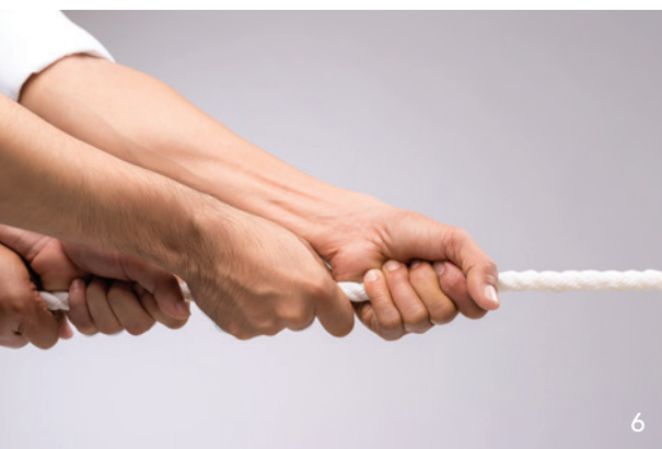
Tauziehen um Bürgerversicherung, keine einheitliche Linie in der Regierungskoalition erkennbar.