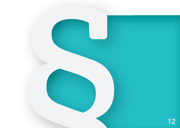
Recht der Personengesellschaften: Was sich ab 1. Januar 2024 für zahnärztliche Berufsausübungsgesellschaften ändert.