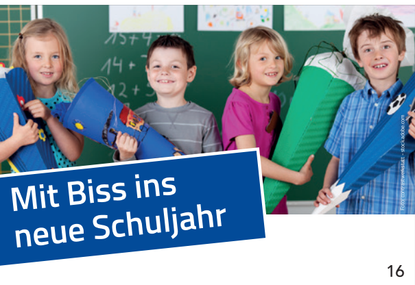
Mit einer bayernweiten Anzeigen-Kampagne erinnert die KZVB Eltern und Kinder an die Kontrolluntersuchung beim Zahnarzt.