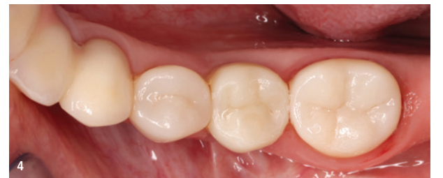
Abb. 1: Fallbeispiel für den Einsatz von CEREC Tessera zur Versorgung der Zähne 35, 36 und 37. – Abb. 2: Ansicht von bukkal. – Abb. 3: Versorgung von Zahn 35 mit einer Krone aus CEREC Tessera. Zahn 36 erhielt eine verschraubte Krone, die aus einem CEREC Tessera Abutment-Block geschliffen wurde. – Abb. 4: Zahn 37 erhielt eine Teilkrone, ebenfalls aus CEREC Tessera.

der Restauration ermöglicht. Wir kennen das bereits aus dem Laborbereich, doch mit diesem Block ist die Technologie nun auch chairside verfügbar. Das Besondere ist, dass wir bei diesem Material keine voneinander abgegrenzten Schichten sehen, sondern einen fließenden, natürlich anmutenden Übergang. Wir können unsere Patienten also nicht nur zügig, sondern gleichzeitig ästhetisch mit hochfesten Restaurationen versorgen. Auf diese Weise wird der Indikationsbereich für Zirkonoxid erweitert. Wir können es auch im ästhetisch sichtbaren Bereich vollaromatisch, also unverblendet, einsetzen, ohne auf die gewohnte Festigkeit zu verzichten – und das ist ein echter Gewinn für die Patienten.