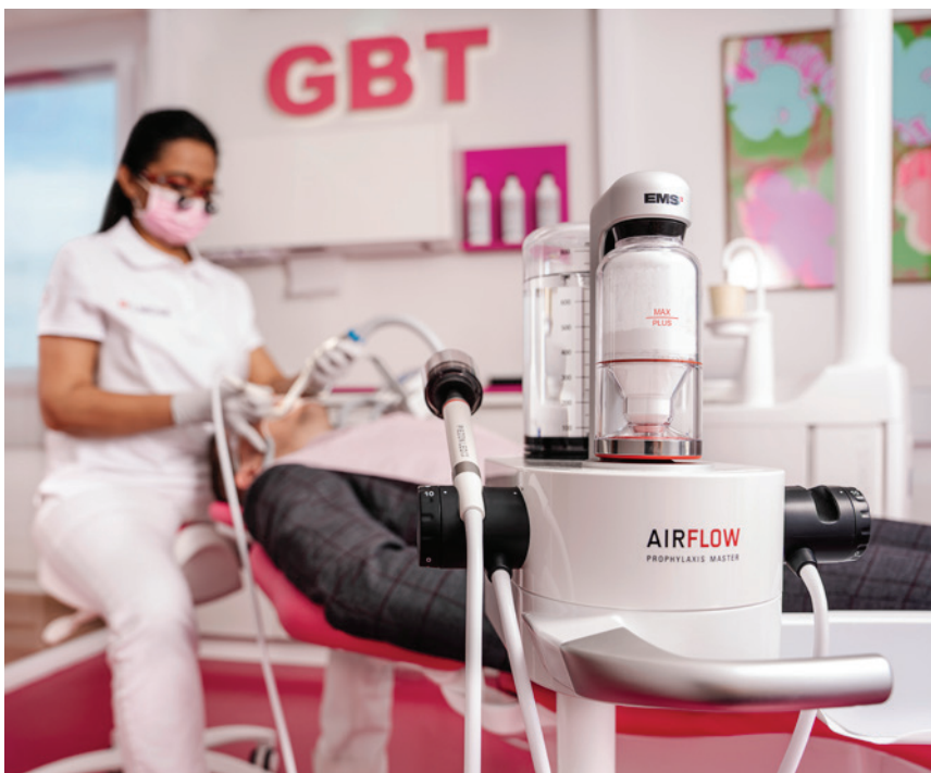
GBT - Die beste PZR aller Zeiten!

Zahnsteinentfernung an Implantaten, Zahnersatz, kieferorthopädischen Apparaturen und Milchzähnen. Die GBT Lounge ist ein weiteres Highlight am EMS Stand. Neben der einzigartigen Optik stimmt jedes ergonomische Detail, und der Raumbedarf ist mit neun Quadratmetern minimal. Die GBT Lounge als Teil des GBT Konzeptes ermöglicht eine optimale Patientenansprache und ist effektiv sowie zeitsparend zugleich. GBT-zertifizierte Praxen bilden ein exklusives Netzwerk, das zahnmedizinische Prophylaxe auf höchstem Niveau anbietet. Werden auch Sie Teil der GBT Bewegung, denn GBT-zertifizierte Praxen stehen für Erfolg, Qualität, Patienten- und Behandlungszufriedenheit und mehr Spaß an der Arbeit! ◀◀