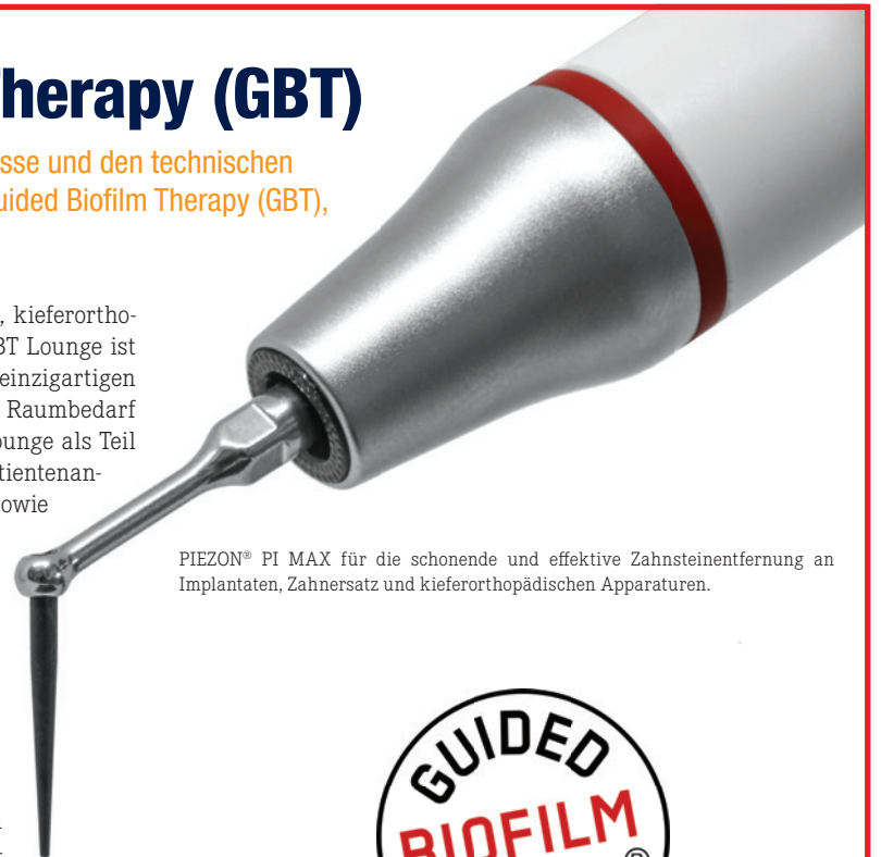
PIEZON® PI MAX für die schonende und effektive Zahnsteinentfernung an Implantaten, Zahnersatz und kieferorthopädischen Apparaturen.