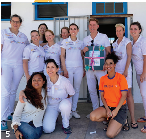
Das Praxis-team der Praxis KU64 aus Berlin bei ihrem Einsatz in Südafrika.

Die Zahnärzte arbeiten auf Plastikstühlen sitzend und ohne höhenverstellbare Einheiten. Die Kinder werden spielerisch mit in die Behandlung integriert, z.B. als Becherhalter.