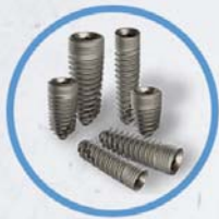
Standard & Narrow Line

Ritter Implants – die Komplettlösung für Ihre Implantatpraxis