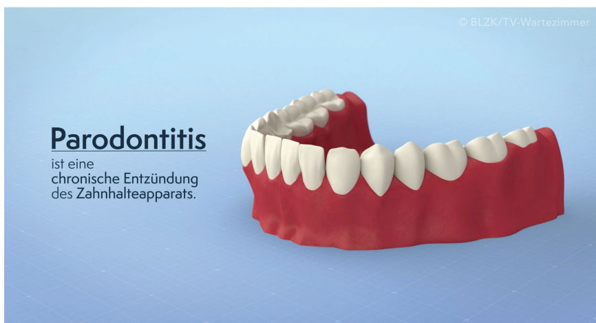
Der Kurzfilm unter www.zahn.de informiert dank zahlreicher Animationen anschaulich über Diagnostik und Therapie der Parodontitis.

Laut Fünfter Deutscher Mundgesundheitsstudie (DMS V) ist bereits jeder zweite jüngere Erwachsene ab 35 Jahren von Parodontitis betroffen. Je früher die entzündliche Erkrankung erkannt wird, desto besser sind die Heilungschancen. Doch häufig bleibt sie lange unerkannt – auch weil viele Betroffene die Warnsignale nicht erkennen. Umso wichtiger ist es, Patientinnen und Patienten laienverständlich über Parodontitis aufzuklären. Die Bayerische Landes Zahnärztekammer bietet hierfür Patienteninformationen in verschiedenen Formaten – Print, Bewegtbild und online.