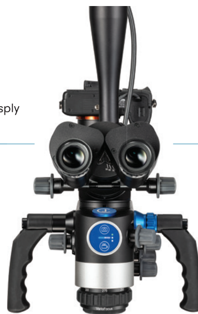
Flexion Twin lite

Ein weiteres wichtiges Tätigkeitsfeld bildet die Betreuung und Ausstattung von Schulungen, Weiterbildungen und Cur-