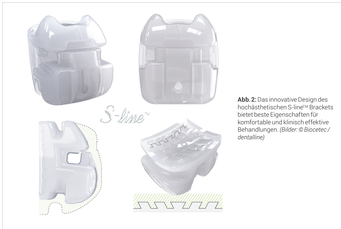
Abb. 2: Das innovative Design des hochästhetischen S-line™ Brackets bietet beste Eigenschaften für komfortable und klinisch effektive Behandlungen. (Bilder: © Biocetec / dentalline)

S-line™ Brackets verfügen über eine anatomisch gewölbte, patentierte Basis mit um 20° nach rechts und links geneigten Unterschnitten. Durch dieses spezielle Design werden ein optimaler Haftverbund sowie ein Debonding mit reduziertem Risiko einer versehentlichen Schmelzschädigung erreicht.