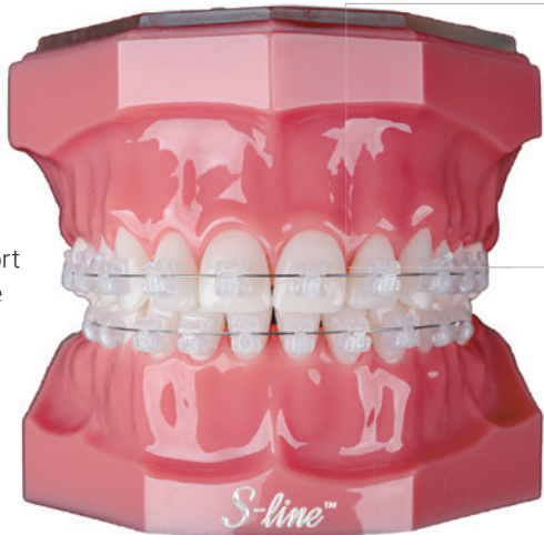
Abb. 1: Das neue passiv selbstligierende Vollkeramikbracket S-line™ – für höchste Ansprüche in Ästhetik, Komfort und Behandlungseffizienz.

Kieferorthopäden, die gern mit passiven SL-Brackets arbeiten und ihren Patienten eine schonende und dennoch effiziente sowie komfortable Behandlung mit einer hochästhetischen Apparatur ermöglichen möchten, steht ab sofort S-line™ zur Verfügung. Das neue polykristalline Bracket bietet neben seiner herausragenden Ästhetik ein innovatives Design mit den besten Eigenschaften eines modernen passiv selbstligierenden Keramikbrackets.