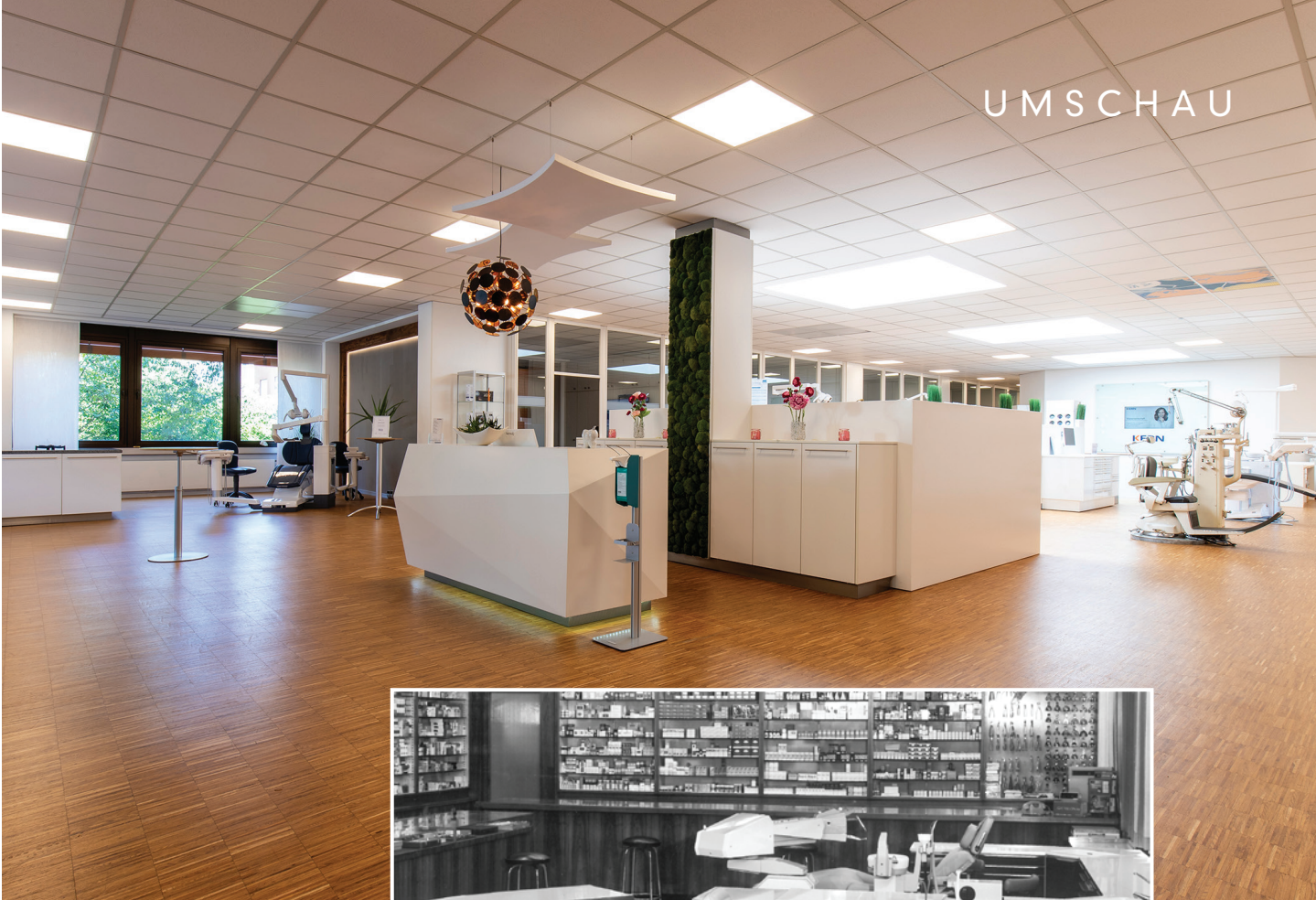
Früher/heute: Geräte, Räume etc.