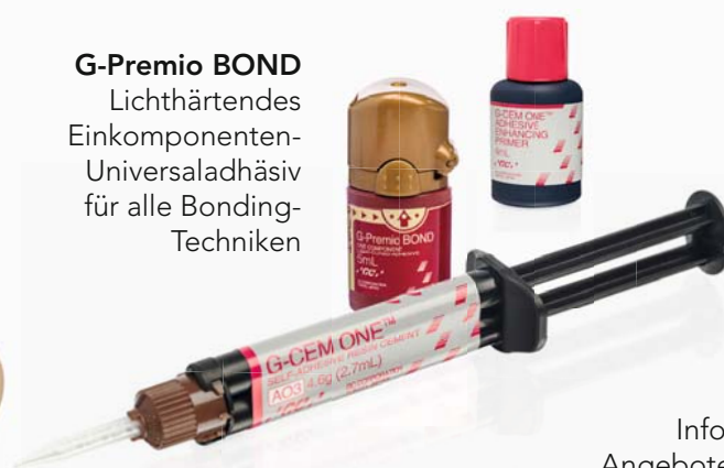
G-CEM ONE Selbstadhäsives, universelles Befestigungs-Composite

Viele weitere Informationen und Angebote finden Sie auf europe.gc.dental/de-DE