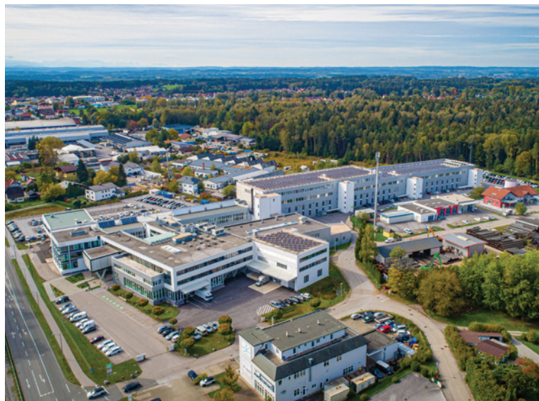
Das Headquarter der internationalen W&H Gruppe liegt in Bürmoos (Österreich).

Es bleibt folglich spannend – die richtigen Weichen in puncto Zukunft sind bereits gestellt.