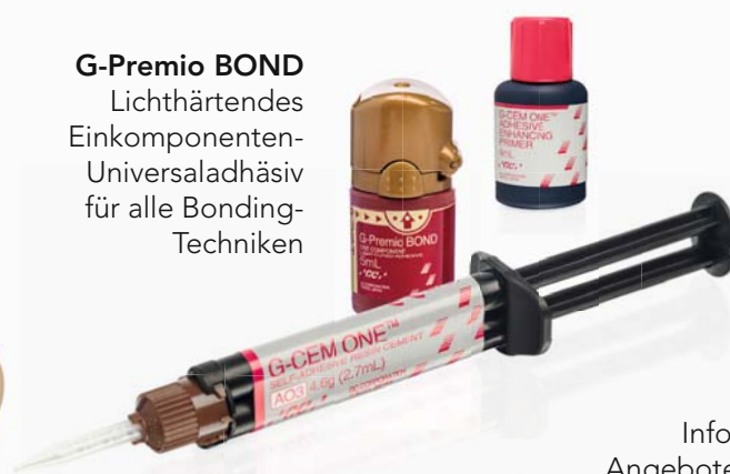
G-CEM ONE Selbstadhäsives, universelles Befestigungs-Composite

Viele weitere Informationen und Angebote finden Sie auf europe.gc.dental/de-DE