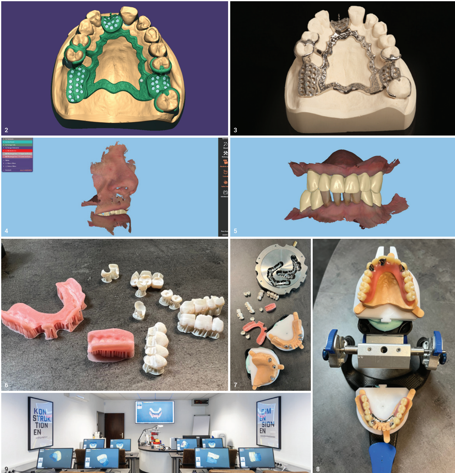
Abb. 2 und 3: Der digitale Modellguss von CAD zu CAM: in exocad designt, im Lasermelting-Verfahren hergestellt. Abb. 4 und 5: Herstellung eines Provisoriums: Als Datengrundlage für ein ästhetisches Design in exocad dient der Gesichtsscan. Abb. 6–8: Wie beim Lego puzzeln: Einzelne zahntechnische Komponenten greifen perfekt ineinander. Abb. 9: In der HD ACADEMY lernen die Teilnehmenden am eigenen Arbeitsplatz, dass zahntechnisches Design im Berufsalltag ganz neue Türen öffnen kann.