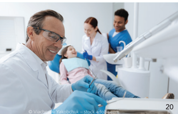
Famulatur leicht gemacht: Die BLZK bietet auf ihrer Website eine neue Famulaturpraxis-Suche für Studierende.