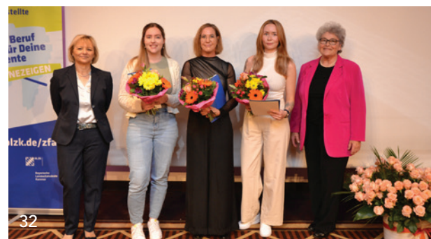
Die drei Jahrgangsbesten der ZFA-Aufstiegsfortbildungen wurden beim Bayerischen Zahnärztetag besonders geehrt.