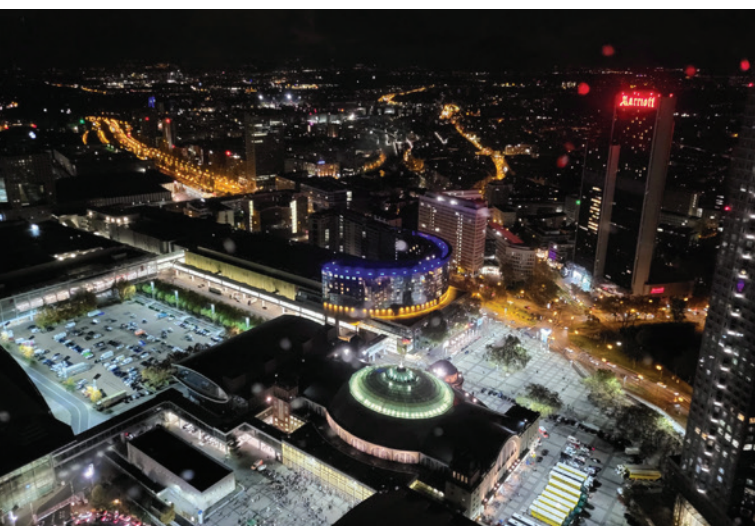
Frankfurt am Main bei Nacht ...

Mehr als 160 Aussteller waren es in Stuttgart bei der Fachdental. Die id infotage dental in Frankfurt am Main wiesen 106 ausstellende Unternehmen aus Industrie, Dienstleistung und Fachhandel auf. Der BDIZ EDI war bei beiden Veranstaltungen als Aussteller dabei und präsentierte sein Wissen und Können rund um die implantologische Fortbildung, die Abrechnung, das Zahnrecht und die Patientenkommunikation.