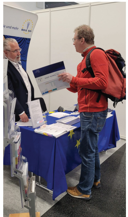
Nach wie vor besonders nachgefragt: die BDIZ EDI-Tabelle 2023.