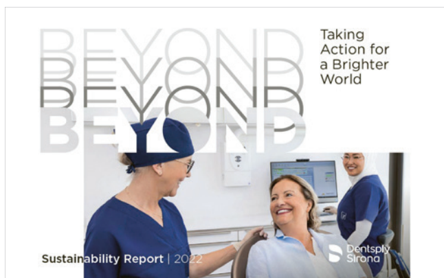
Cover des Nachhaltigkeitsberichts 2022 von Dentsply Sirona.

Tel.: +1-800-877-0020 contact@dentsplysirona.com www.dentsplysirona.com