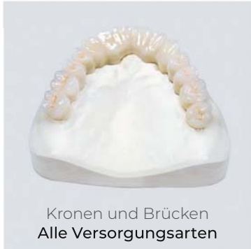
Kronen und Brücken Alle Versorgungsarten