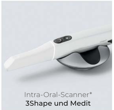
Intra-Oral-Scanner* 3Shape und Medit

*Permadental verarbeitet die Daten sämtlicher gängigen Scanner-Systeme.