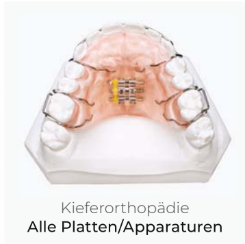
Kieferorthopädie Alle Platten/Apparaturen