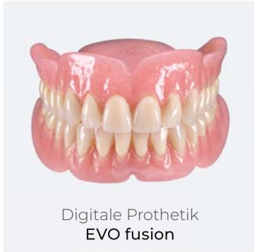
Digitale Prothetik EVO fusion