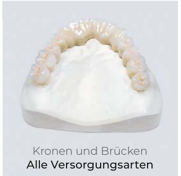
Kronen und Brücken Alle Versorgungsarten