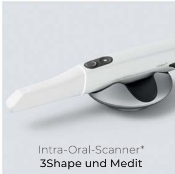
Intra-Oral-Scanner* 3Shape und Medit

*Permadental verarbeitet die Daten sämtlicher gängigen Scanner-Systeme.