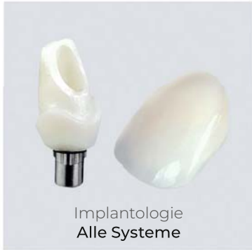
Implantologie Alle Systeme