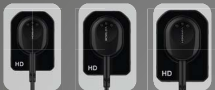
opt-on® / spot-on®