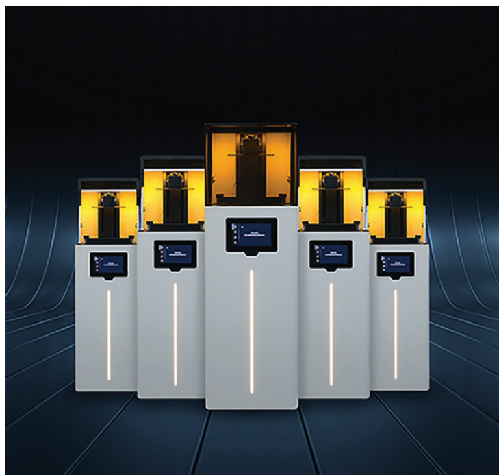
UNIZ-Resindrucker SLASH 2 PLUS.

Der SLASH 2 PLUS realisiert den gleichzeitigen Druck von sechs Alignermodellen in ca. 18 Minuten. Der NBEE schafft dies sogar in einer weltweit neuen Rekordzeit von nur rund fünf Minuten. Diese Werte erreichen die Geräte bei einer Schichtstärke von 100 µm, wobei sie zudem eine Genauigkeit von 98,6 Prozent gegenüber dem Datenmodell gewährleisten. Das jeweils beeindruckende Tempo sowie die hohe Präzision beim