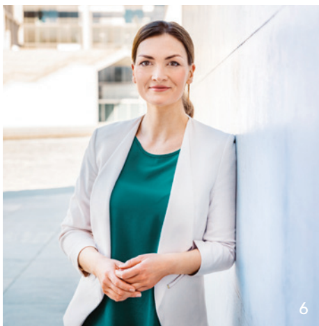
Im Interview mit dem BZB erläutert die neue bayerische Gesundheitsministerin Judith Gerlach ihre Ziele.