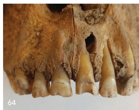
Bei der Untersuchung von Zähnen aus der Wikingerzeit kamen schwedische Forscher zu erstaunlichen Ergebnissen.

Die Herausgeber sind nicht für den Inhalt von Beilagen verantwortlich.