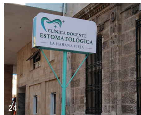
Sozialismus unter Palmen – ein Blick hinter die bröckelnden Kulissen des Gesundheitssystems auf Kuba.