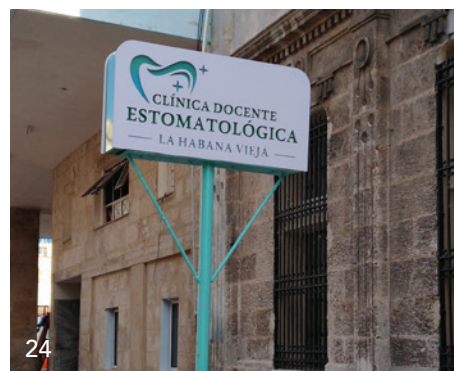
Sozialismus unter Palmen – ein Blick hinter die bröckelnden Kulissen des Gesundheitssystems auf Kuba.