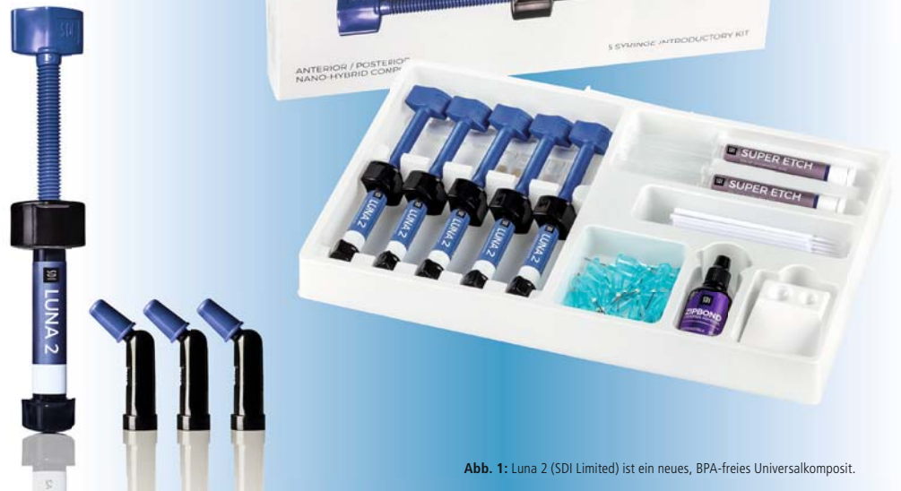
Abb. 1: Luna 2 (SDI Limited) ist ein neues, BPA-freies Universalkomposit.