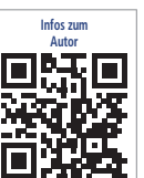
Infos zum Autor

MediKom Consulting GmbH Obere Bergstraße 35 90607 Rückersdorf Deutschland Tel.: +49 911 99087030 w.apel@medikom.org www.medikom.org Podcast: unternehmenarztpraxis.podigee.io