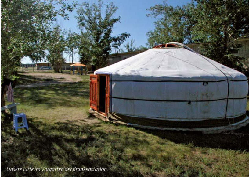
Unsere Jurte im Vorgarten der Krankenstation.