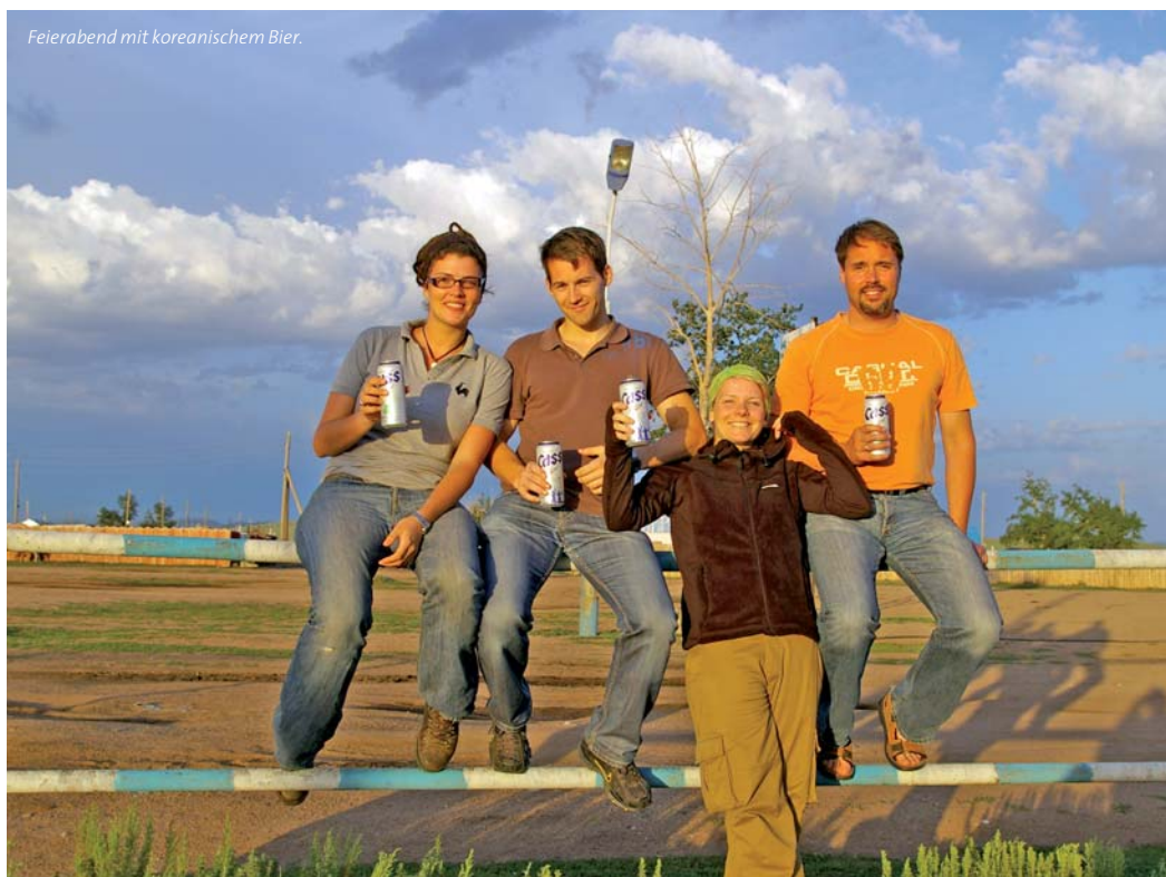
Feierabend mit koreanischem Bier.

So wie wir die endlose Landschaft kennengelernt haben als harmonische Komposition aus dem strah-