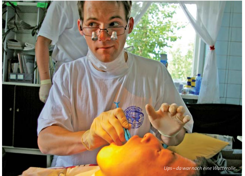
Ups – da war noch eine Watterolle.

Die Behandlungsstühle ließen sich nur dann in der Höhe verstellen, wenn niemand auf ihnen lag. Das zeitraubende Verstellen ließen wir irgendwann sein und kämpften abends dann mit Rückenschmerzen. Geschlafen wurde in einer Jurte im Vorgarten der Krankenstation in kleinen Holzbetten. Als Mann mit europäischen Mittelmaßen darf man sich nachts leider nicht bewegen, sonst stößt man sich irgendwo. Die Nächte, die wir draußen in unserer Jurte verbrachten, fühlten sich so an, als seien wir unterwegs auf Klassenfahrt. Sechs Rucksäcke standen vor sechs kleinen Betten, an den Dachstreben hingen feuchte Handtücher zum Trocknen und ich suchte meine