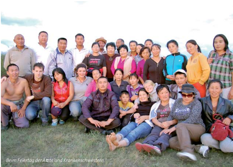
Beim Feiertag der Ärzte und Krankenschwestern.

lendem Weiß der Wolken, dem blassblauen Himmel, garniert mit gras- bis gelbgrünen sanft ansteigenden Hügeln, so haben sich auch die Menschen in unseren Herzen verewigt.