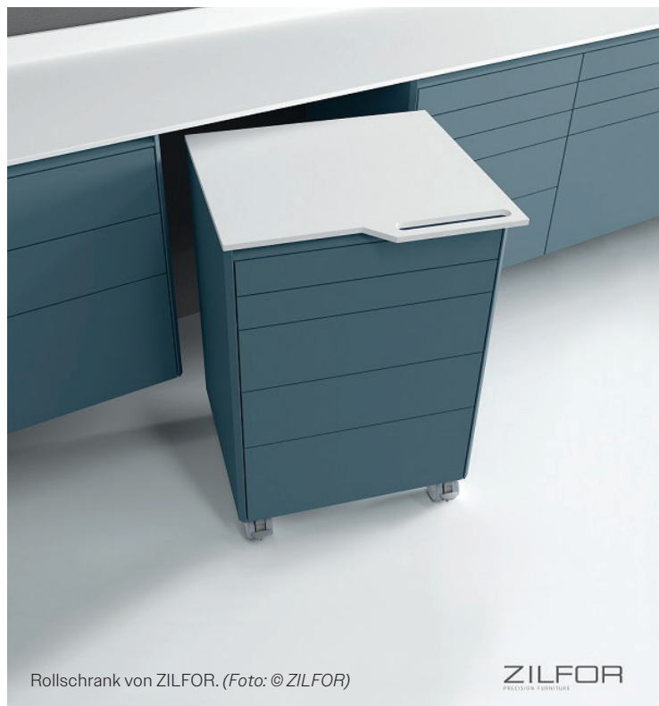
Rollschrank von ZILFOR.

Die Behandlungszimmer dienen als Verlängerung des Wohlfühl-Wartebereichs. Bedeutet, Stil und Farbkonzept aus dem Empfangs- und Wartebereich sollten sich im Idealfall auch dort wiederfinden. Das ist selbstverständlich nicht immer zu 100 Prozent umsetzbar. Gerade im Falle eines Umbaus oder Teilumbaus kann es zu starken Unterschieden zwischen den Stilen oder Farbkombinationen kommen. Hier kann es gegebenenfalls ratsam sein, dem Behandlungszimmer entweder ein völlig eigenes Konzept zu geben – eventuell bekommt jedes Behandlungszimmer ein eigenes Farbthema – oder die Behandlungsräume werden so neutral wie möglich eingerichtet. Vertrauen Sie auf die Kompetenz von Korr Dental. Mit den individuell planbaren Behandlungszeilen von ZILFOR sind nahezu alle Farb- und Materialkombinationen im Baukastenprinzip möglich. Passend dazu haben wir neutrale oder farbenfrohe Behandlungseinheiten, Sattelhocker und Co. im Angebot.