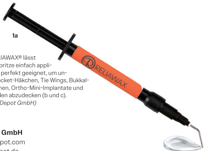
Abb. 1a-c: RELIAWAX® lässt sich dank der Spritze einfach applizieren (a). Es ist perfekt geeignet, um unerwünschte Bracket-Häkchen, Tie Wings, Bukkalröhrchen-Häkchen, Ortho-Mini-Implantate und Drahtbogenenden abzudecken (b und c).

Dieses neue sehr hilfreiche Produkt ist ab sofort unter www.orthodepot.de bestellbar.