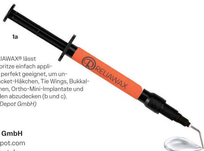
Abb. 1a-c: RELIAWAX® lässt sich dank der Spritze einfach applizieren (a). Es ist perfekt geeignet, um unerwünschte Bracket-Häkchen, Tie Wings, Bukkalröhrchen-Häkchen, Ortho-Mini-Implantate und Drahtbogenenden abzudecken (b und c).

RELIAWAX® von Reliance Orthodontic Products ist ein zuverlässiger und revolutionärer wachstypischer Schutz in einer Spritze, welcher Patienten einen dauerhaften Komfort bietet. Es handelt sich um ein kristallklares lighthärtendes Gel. RELIAWAX® wird direkt in der Praxis aufgetragen, mit UV-Licht ausgehärtet und verbleibt danach für sechs bis acht Wochen bis zum nächsten Termin an der gewünschten Stelle. Es eignet sich ideal zur Abdeckung störender Bracket-Häkchen, Tie Wings, Bukkalröhrchen-Häkchen, Ortho-Mini-Implantate sowie Drahtbogenenden. RELIAWAX® kann direkt appliziert werden. Es ist kein Ätzen, Grundieren oder eine Konditionierung erforderlich. Direkt nach dem Aushärten bietet es einen angenehm weichen Schutz, der auch routinemäßigem Zähneputzen und Essen standhält. Durch die hohe Transparenz ist es intraoral fast unsichtbar. Sobald RELIAWAX® nicht mehr benötigt wird, kann es einfach vom Haken, TAD usw. in einem Stück komfortabel abgezogen werden. Bei Bedarf kann es mit Schwarz- oder UV-Licht sichtbar gemacht werden. Dieses neue sehr hilfreiche Produkt ist ab sofort unter www.orthodepot.de bestellbar.