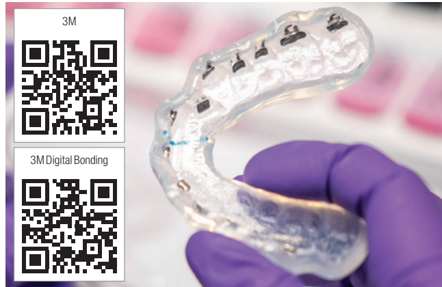
3M Digital Bonding: Effizienter und sicherer Workflow führt zu präzisen Ergebnissen.

Überschussfreies Kleben kompletter Kiefer in einem Schritt, und das im validierten Prozess: Möglich macht es das 3M Digital Bonding. Nutzen kann es jede kieferorthopädische Fachpraxis in Deutschland mit Intraoralscanner und Zugang zum neuen 3M Oral Care Portal. Nun wurde das System erweitert: Ab sofort können 3M Digital Bonding Trays auch für die Behandlung mit 3M SmartClip SL3 Selbstligierenden Metallbrackets bestellt werden. Bereits seit Ende 2023 steht das System darüber hinaus für Behandlungen mit 3M Clarity Advanced Keramikbrackets, 3M Victory Series Low Profile Metallbrackets und 3M Victory Series Superior Fit Bukkalröhrchen zur Verfügung. Dabei haben Anwender jeweils die Wahl zwischen Brackets mit und ohne 3M APC Flash-Free Adhäsivvorbeschichtung, die vorbeschichtete Variante bietet aber zusätzliche Vorteile. Schließlich entfallen bei Verwendung dieser