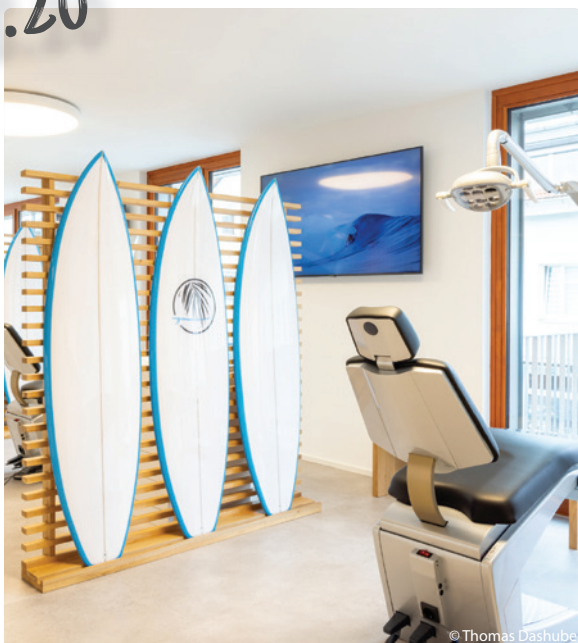
California Flair in Grafing bei München