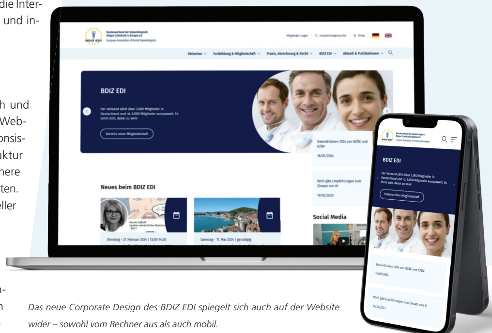
Das neue Corporate Design des BDIZ EDI spiegelt sich auch auf der Website wider – sowohl vom Rechner aus als auch mobil.