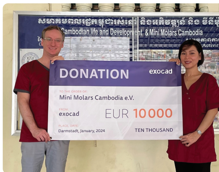
exocad hat 10.000 Euro an die in Deutschland ansässige Non-Profit-Organisation Mini Molars Cambodia e.V. gespendet.

exocad, ein Unternehmen von Align Technology, Inc. und ein führender Anbieter von dentaler CAD/CAM-Software, hat 10.000 Euro an die in Deutschland ansässige Non-Profit-Organisation Mini Molars Cambodia e.V. gespendet. Ein Teil der Spende stammt aus den Einnahmen eines Charity-T-Shirt-Verkaufs auf der Internationalen Dental-Schau (IDS) 2023 sowie Spenden von exocad Angestellten weltweit. Vertreter von Mini Molars geben an, dass die Spende die Organisation in ihrer Arbeit unterstützt, Kindern in Kambodscha eine zahnmedizinische Versorgung zu ermöglichen, die sonst keinen Zugriff auf entsprechende Behandlungen haben. Das Unternehmen unterstützt aktiv weltweite Bemühungen, die Zahngesundheit zu verbessern, vor allem bei Kindern. Mini Molars bietet zahnmedizinische Versorgung in einer Pagode in Phnom Penh, in der auch andere Hilfsprojekte angeboten und Kinder aus Schulen versorgt werden. Die Mitarbeiter der Organisation reisen ebenfalls mit mobilen Behandlungseinheiten in Gemeinden in ganz Kambodscha. Weitere Informationen zum Projekt sind verfügbar unter www.minimolars.de