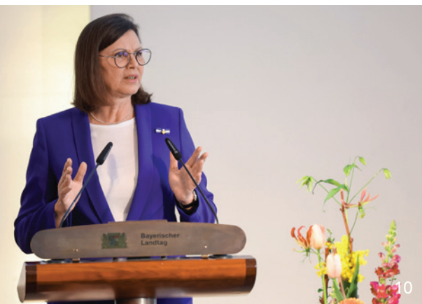
Landtagspräsidentin Ilse Aigner überreichte im Rahmen eines Festaktes den Bayerischen Verfassungsorden, unter anderem an zwei Zahnärzte.