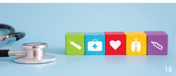
Im Entwurf des neuen Grundsatzprogrammes bekennt sich die CDU klar zum dualen System der Krankenversicherungen und zur Selbstverwaltung.