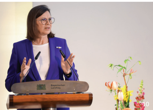
Landtagspräsidentin Ilse Aigner überreichte im Rahmen eines Festaktes den Bayerischen Verfassungsorden, unter anderem an zwei Zahnärzte.