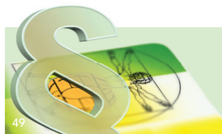
Gesetzliche Neuregelung – Asylbewerber erhalten erst nach 36 Monaten Aufenthalt in Deutschland die elektronische Gesundheitskarte.