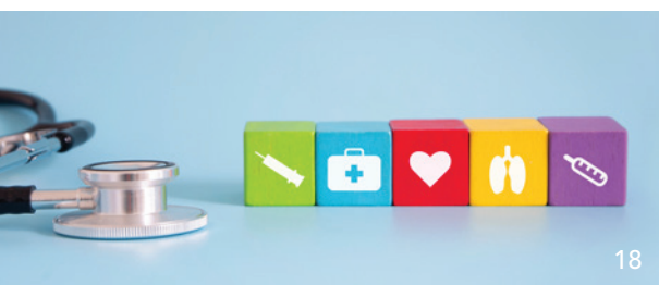
Im Entwurf des neuen Grundsatzprogrammes bekennt sich die CDU klar zum dualen System der Krankenversicherungen und zur Selbstverwaltung.