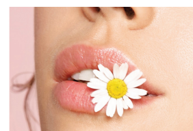
Die „Wirkung“ Mund-Wund-Pflaster