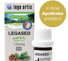
Die Naturharzlösung LEGASED natur