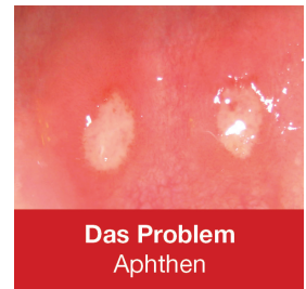
Das Problem Aphthen